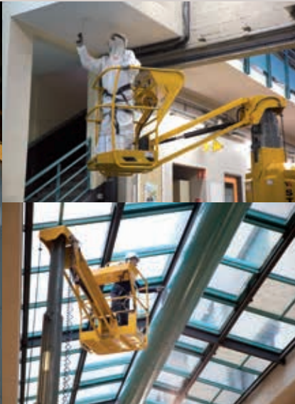
INNENAUSBAU (Elektrik, Beleuchtung, Sanitär, Anstrich, Klimaanlage, Verrohrung, Brandmeldeanlagen, etc.)