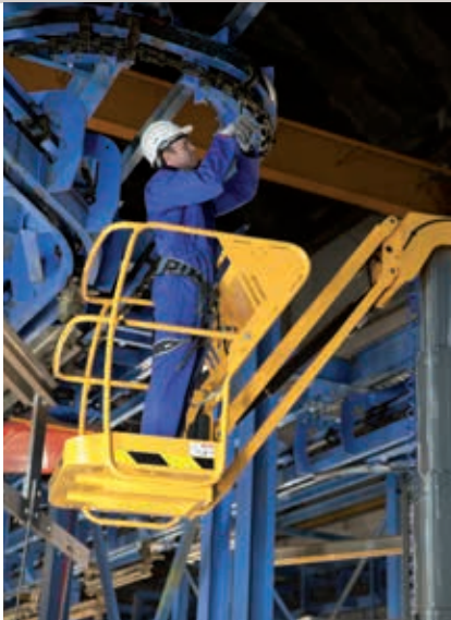
WARTUNG UND INDUSTRIELLE REINIGUNG