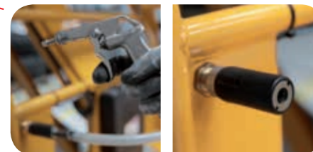
Druckluftanschluß im Korb