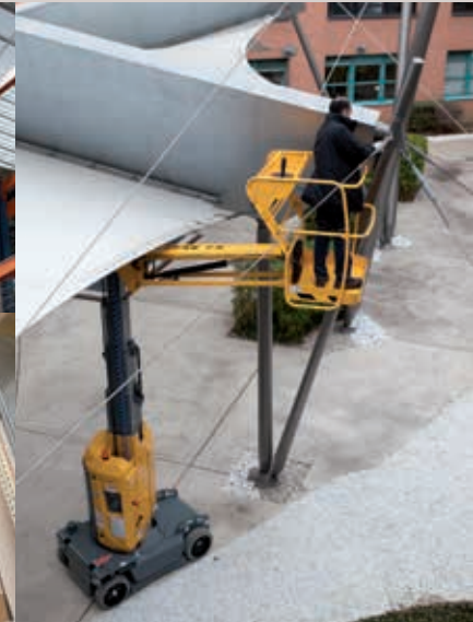
VERANSTALTUNGEN (Messen, Fernsehstudios, Konzerte, etc.)