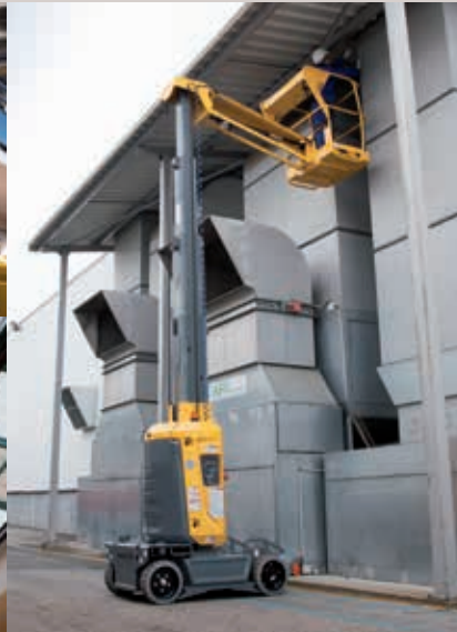
WARTUNG UND ÄNDERUNGEN AN ÄUSSEREN GEWERKEN (Beleuchtung, Beschilderung, Reparaturen, etc.)